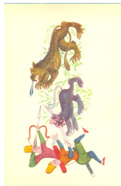
Илл. 10. Акоп Джугаеци XVI–XVII вв.

Таким образом, рассматривая одну из интересных сторон жизни средневекового человека – пиршественную трапезу, можно сделать вывод, что кажущаяся на первый взгляд основная цель пира – поесть и поговорить – на самом деле не так проста, ибо пир при более глубоком рассмотрении являлся своеобразным критерием социальных связей и средством межчело-