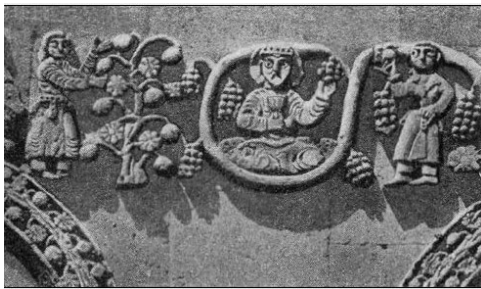
Илл. 7. Царь Гагик Арцруни с кубком в руке. Церковь Сурб Хач.

После вина гостей ожидали разнообразные шербеты и прохладительные напитки, которые должны были ослабить действие крепких вин.