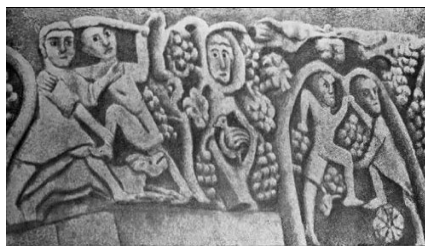
Илл. 9. Рукопашная борьба и кулачный бой. Церковь Сурб Хач.