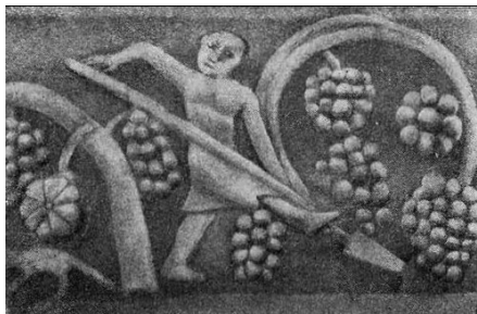
Илл. 6. Обработка виноградника. Церковь Сурб Хач.

Сурб Хач тянется виноградный фриз, на котором изображены сцены обработки виноградника, уборки урожая, винопития 9 (Илл. 6) и (Илл. 7). Виноградно-гранатовый фриз присутствует также на фасаде храма Звартноц.