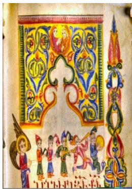
Илл. 8. Евангелие Мокс. 1588–1590.

В киликийских миниатюрах часто встречаются великолепные сцены охоты и боя животных. Сцены эти помещены в хорах 10 Евангелия: в начале глав и на полях в виде заставок, маргиналов, а также зоографических и орнаментированных инициалов (Илл. 10). Эти маленькие композиции, блестящие мастерством исполнения и естественностью, свидетельствуют не только о таланте художника, но и о любви народа к светскому искусству и о том, что охота была одним из любимейших развлечений того времени. В качестве охотничьего оружия в миниатюрах представлены лук, стрелы, меч, сабля и кинжал. Заслуживает внимания миниатюра художника XVI–XVII вв. Акопа Джугаеци, изображающая охоту на льва. Здесь нарисована очень своеобразная стрела; хвостовая часть ее заполнена свинцом для придания большей меткости удару.