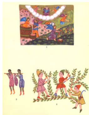
Илл. 5. Сбор винограда XVII век.