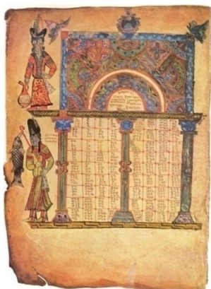
Илл. 4. Евангелие из Мугни 1211г. Художник Маргаре.

Средневековые миниатюры и памятники архитектуры дают представление о виноградарстве и плодоводстве в Армении. Заслуживает особого внимания миниатюра XVII века, на которой изображены сбор винограда и приготовление вина. Сами виноградари представлены в виде ангелов (Илл. 5).