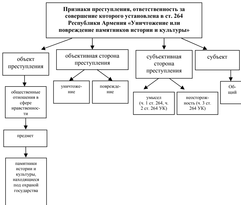
Рис. 1. Анализ признаков состава преступления «Уничтожение или повреждение памятников истории и культуры» (ст. 264 УК Республики Армения).

5. Уничтожение или повреждение памятников истории и культуры (ст. 264 Уголовного кодекса Республики Армения). На рис. 1 представлен анализ признаков этого состава преступления.